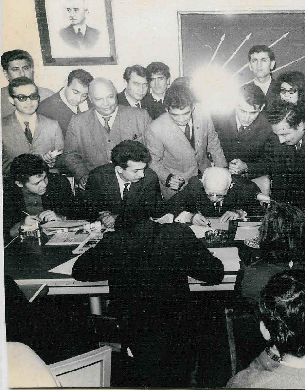
1965 CHP Genel