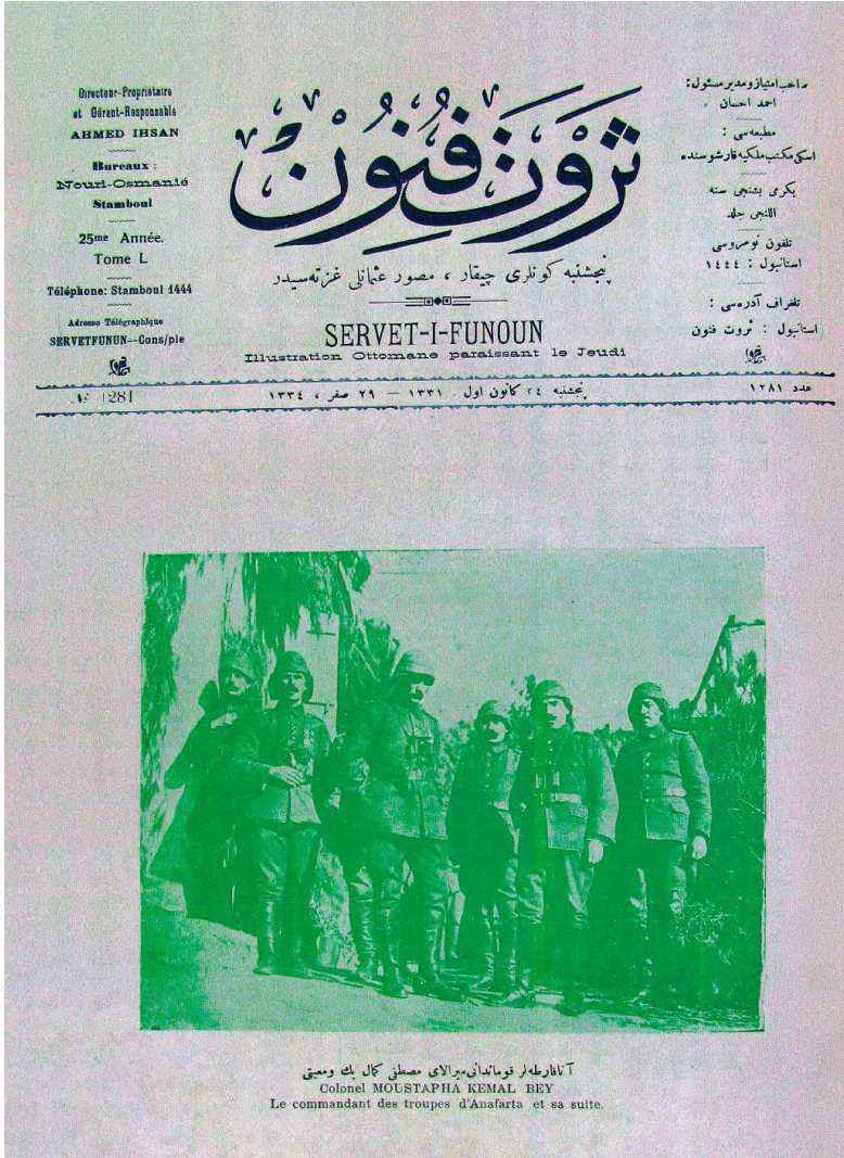
Serveti Fünun Dergisi Kapağı, 24 Aralık 1915