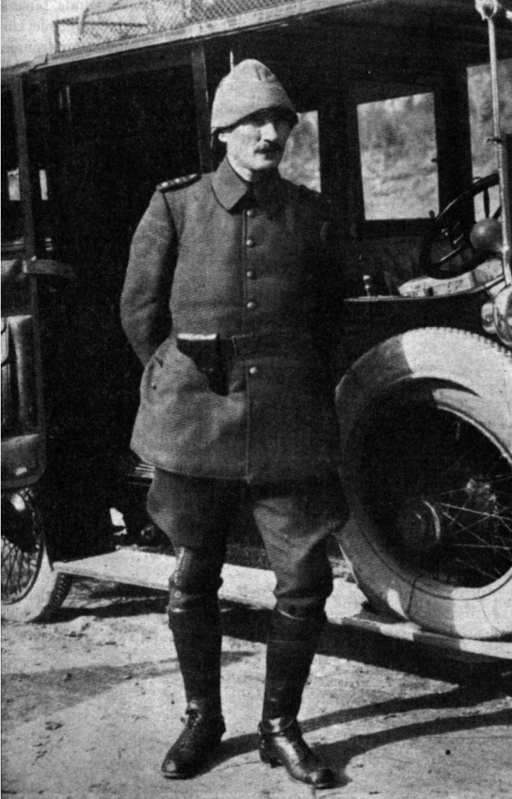
Mustafa Kemal Anafartalar'dan İstanbul'a Dönerken Keşan'da, Aralık 1915