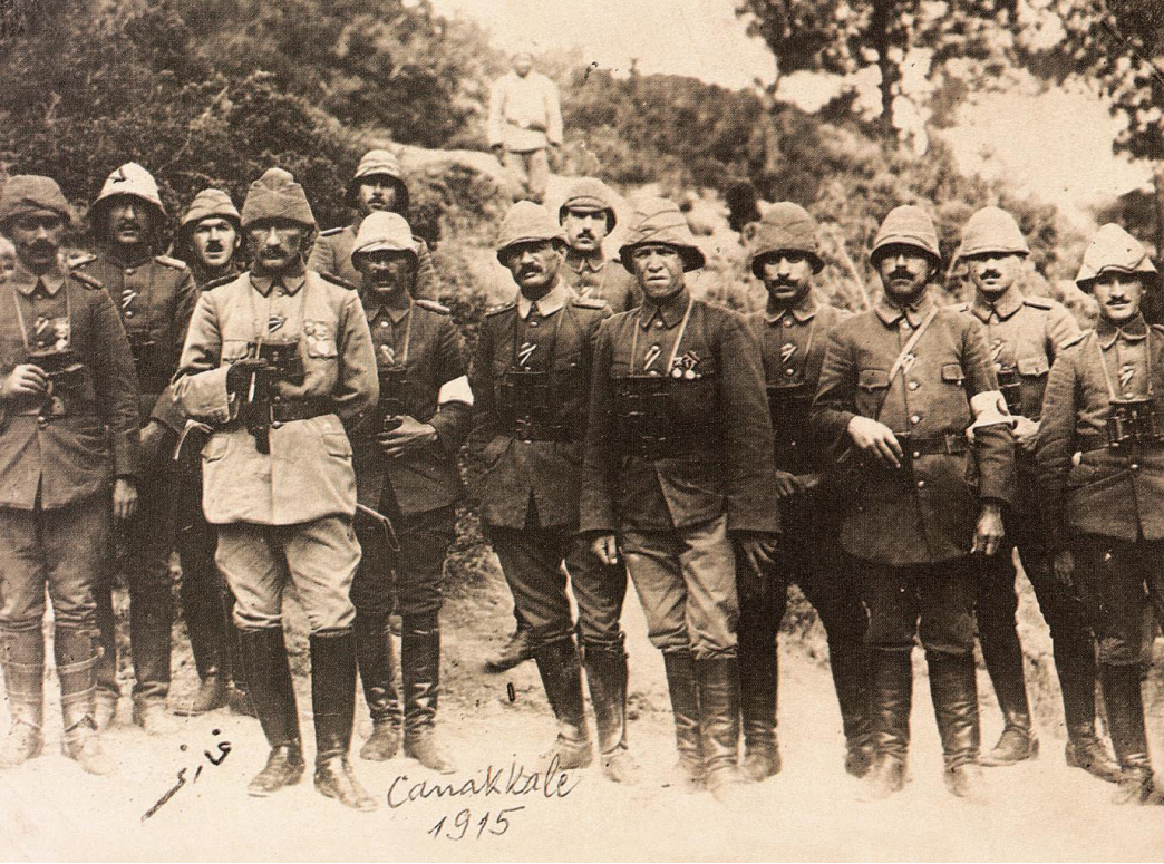
Anafartalar Grup Komutanı Albay Mustafa Kemal