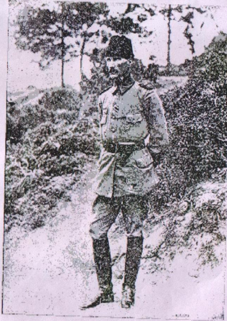
Şark'ın Kurtarıncısı, Çanakale'de Çanakaleli Kurtarıncı