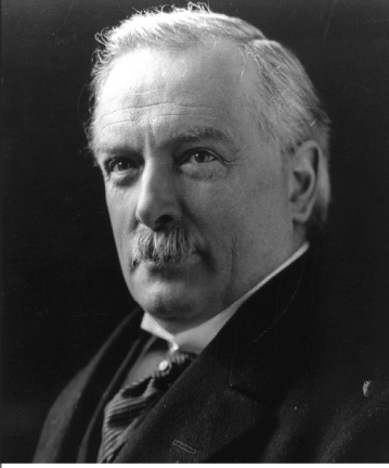
Resim-1 : İngiltere Başbakanı Lloyd George (1863 - 1945)

İngiltere'nin Engelleme Girişimleri: Özellikle İngiltere bağımsız bir Müslüman ülkenin bulunmasını, Müslüman sömürgeleri bulunan ülkeler için rahatsızlık verici olarak görmüştür. Bağımsız Müslüman bir ülkenin örnek alınabilir olması, sömürgeci düzeni tehdit edebilirdi. İşte Anadolu'da kapitülasyonlara karşı olan, milli bir ekonomi kurma amacıyla bulunan tam bağımsız bir hareketin gelişmekte olması, sömürge olan bütün