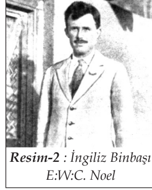
Resim-2 : İngiliz Binbaşı E:W:C. Noel

Noel, Kürtler üzerinde etkili olabilmek için, öldürülen Ermenilerle ilgili olarak af ilan edilmesini ve sadece Ermenilere ait taşınmaz malların geri istenmesi konusunda bir duyuru yapılmasını İngiltere'den istemiştir. Çünkü öldürülen Ermeniler ile ilgili olarak çoğunlukla Kürtler sorumlu görülmektedir. Bu da Kürtçülerin, İngiltere'ye yaklaşmasını engellemiştir. Bunun üzerine Balfour da, Kürtlere karşı intikamcı bir siyaset izlenmeyeceği konusunda Noel'in garanti verebileceğini bildirmiştir.