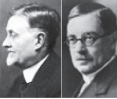
Resim-5 : King ve Crane

rikan Senatosu tarafından da dikkate alınması ihtimalinden söz etmiştir. İşte her şey bundan sonra gelişmiştir. 128