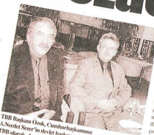
TBB Başkanı Özok, Cumhurbaşkanı A.Necef Sezer'in devlet başkanı olmaması şansı olduğunu TBB olarak desteklediklerini açıkladı

Günlük Tarafsız Siyasal Gazete ODAK 31 Ocak 2002 PERŞEMBE 250.000 TL (KDV Dahil)