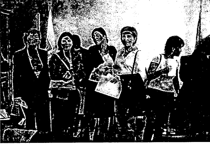
TÜBAKKOM Adana Paneli.