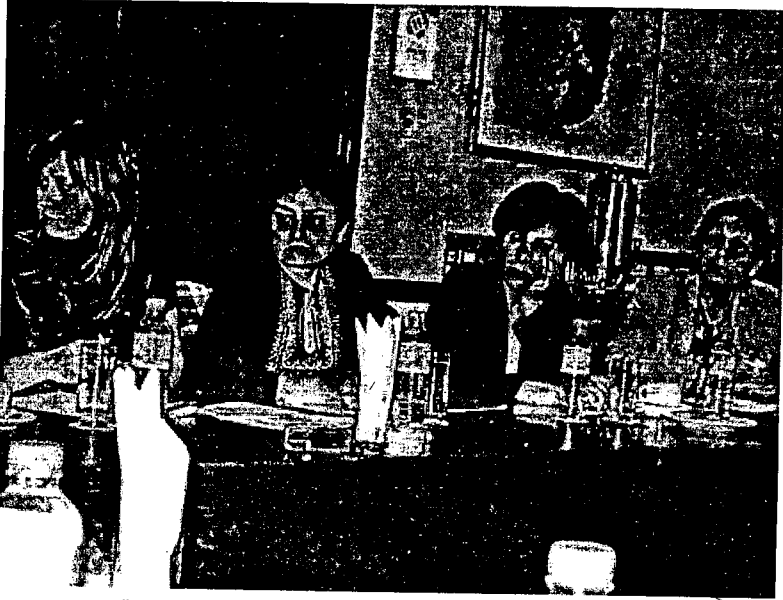
TÜBAKKOM Adana IV. Yürütme Kurulu Toplantısı.