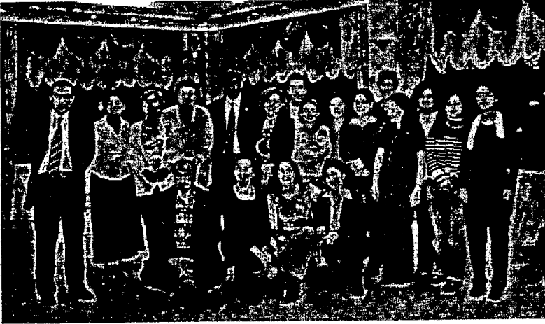
TÜBAKKOM Van I. Genel Üye Toplantısı'na katılanlar.