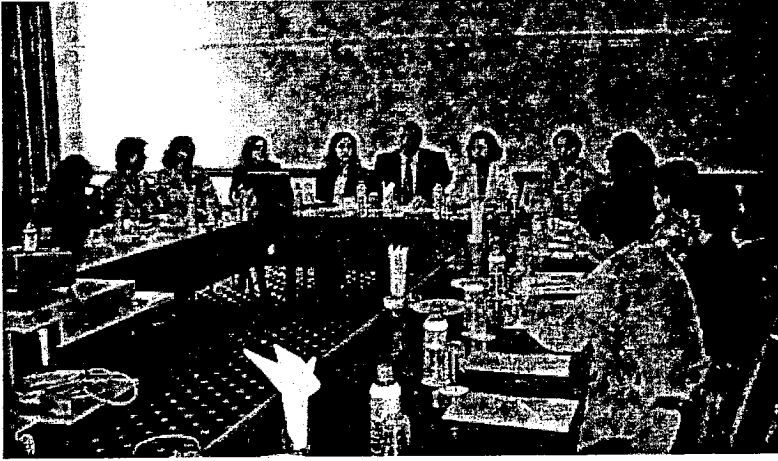
TÜBAKKOM Adana IV. Yürütme Kurulu Toplantısı.