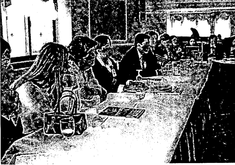
TÜBAKKOM Van I. Genel Üye Toplantısı.