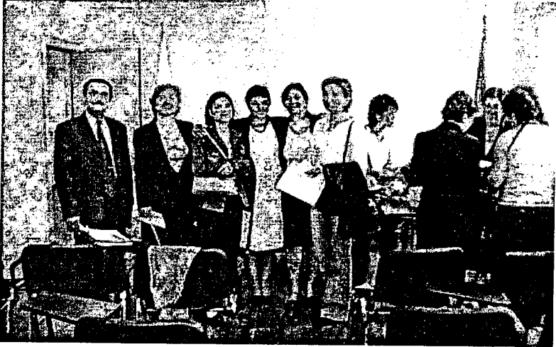
TÜBAKKOM Adana Paneli.