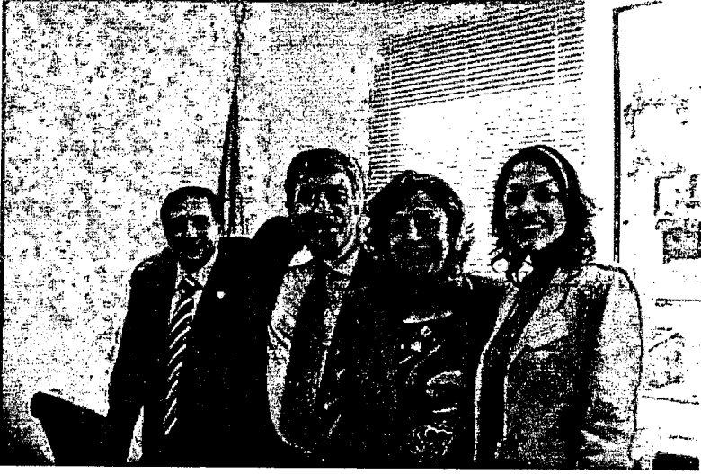
TÜBAKKOM Adana Paneli.