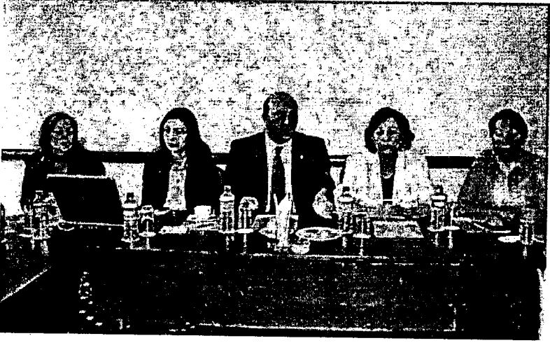
TÜBAKKOM Adana IV. Yürütme Kurulu Toplantısı.