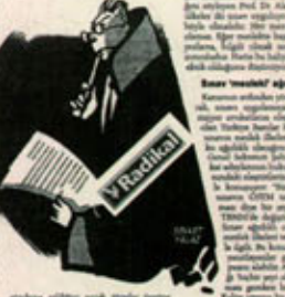
Avukatlık Sınavı, hukuk çevrelerinde tartışma yarattı. Avukatlık adayları, 'Yetenimizle sınava ölüme' diyor. Hocalara göre, meslekte kaita sağlamlık için sınav şart.

Avukatlık Sınavı, hukuk çevrelerinde tartışma yarattı. Avukatlık adayları, 'Yetenimizle sınava ölüme' diyor. Hocalara göre, meslekte kaita sağlamlık için sınav şart. Hukuk fakültelerinde okuyan öğrenciler, sınavın zor olduğunu ve meslekte kaita sağlamlık için sınav şart olduğunu söylüyorlar. Hukuk fakültelerinde okuyan öğrenciler, sınavın zor olduğunu ve meslekte kaita sağlamlık için sınav şart olduğunu söylüyorlar.