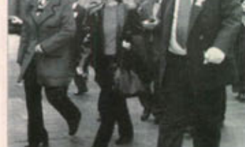
Özdemir Özok, 'Savunmanın, haksızlığın yarattığı korku ve kaygıyı ortadan kaldırmak için yapılmadıkça işkence olduğunu söyledi. Özok, Cezaevlerinde arama ve elyazmaların işkence boyutunda olduğunu söyledi. Yürütme Kurulu Üyesi Eser İnaner ile Özok, Cezaevlerinde arama ve elyazmaların işkence boyutunda olduğunu söyledi.

Türkiye Barolar Birliği Başkanı Özok, 'Savunmanın, haksızlığın yarattığı korku ve kaygıyı ortadan kaldırmak için yapılmadıkça işkence olduğunu söyledi. Özok, Cezaevlerinde arama ve elyazmaların işkence boyutunda olduğunu söyledi. Yürütme Kurulu Üyesi Eser İnaner ile Özok, Cezaevlerinde arama ve elyazmaların işkence boyutunda olduğunu söyledi.