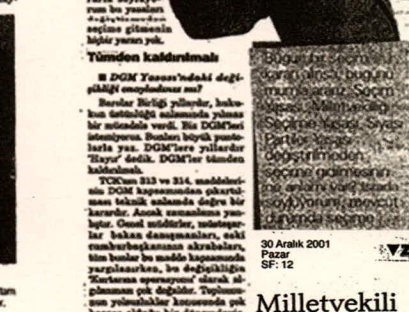
30 Aralık 2001 SF: 12