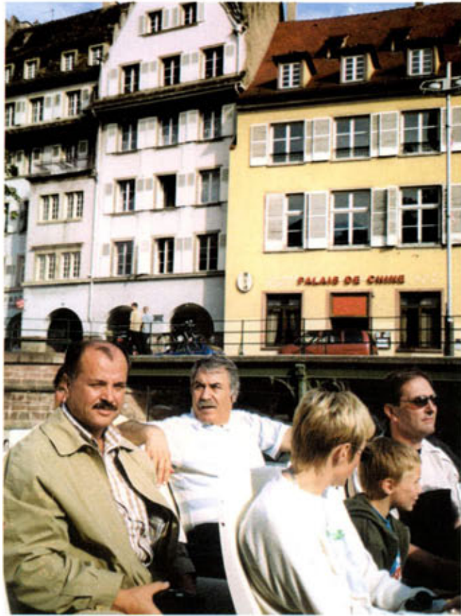
Strasbourg'da kanal gezisi