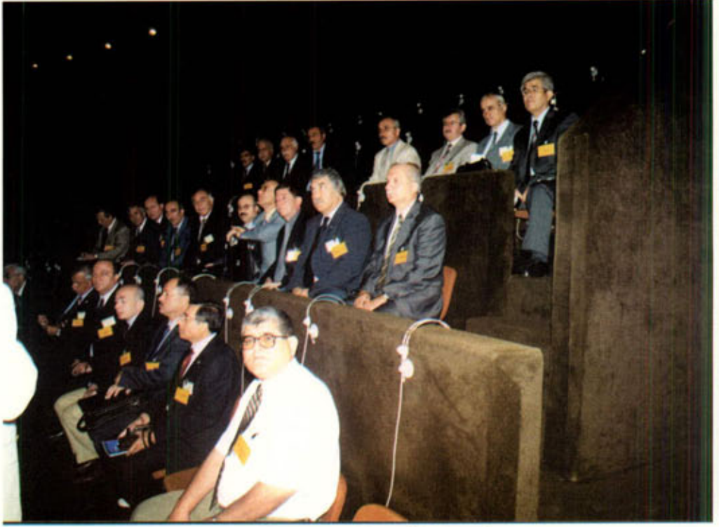
Avrupa Parlamentosu'nda açıklama yapılıyor