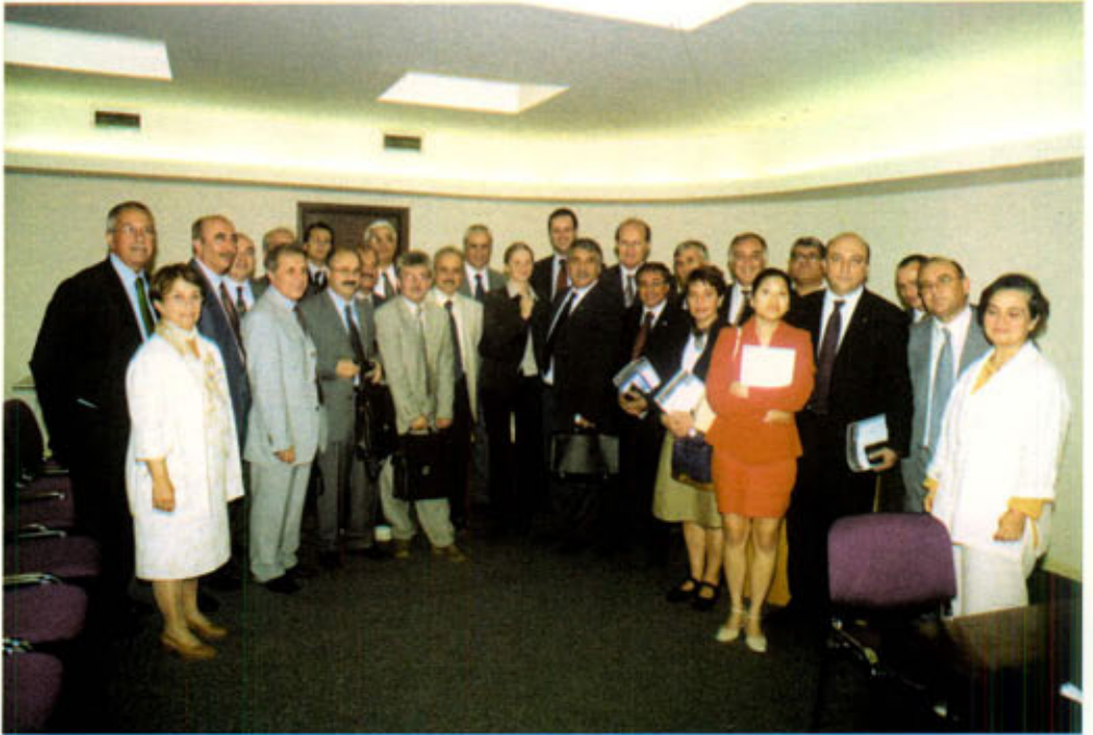
Büyükelçilikte CCBE yetkilileriyle