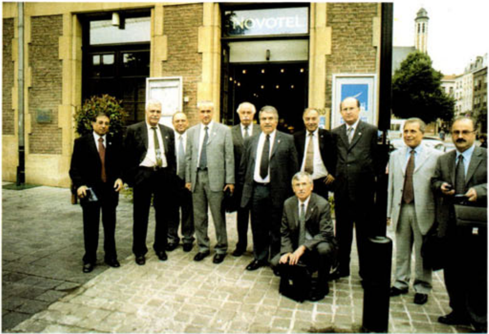
Brüksel Nova Otel önünde