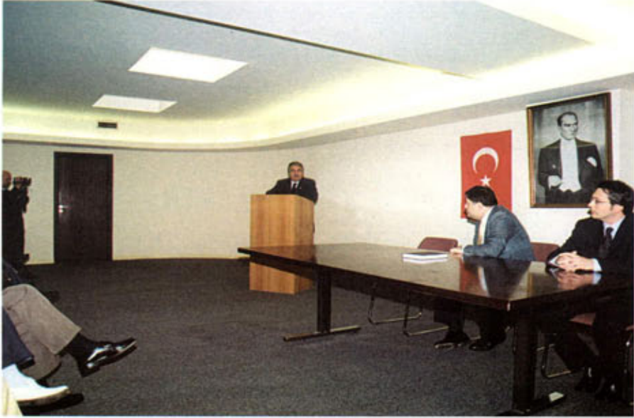
Avrupa Birliği Türkiye delegasyonunda brifing