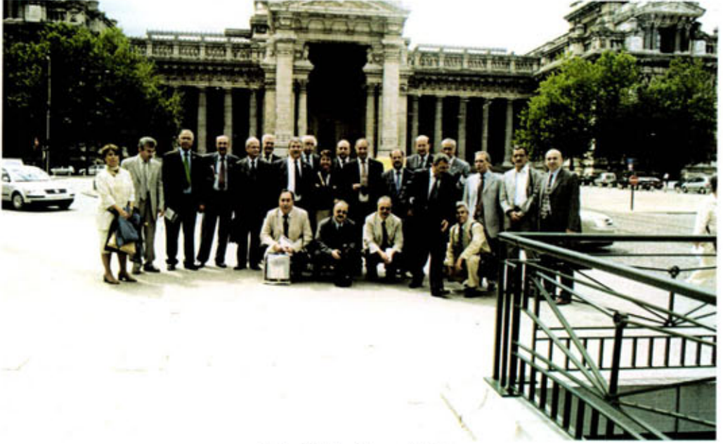
Brüksel Adliye Sarayı önünde