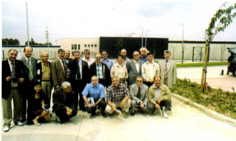
Itre (Brüksel) cezaevi