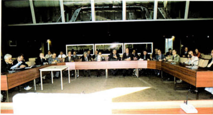
Avrupa Parlamentosu binasında brifing