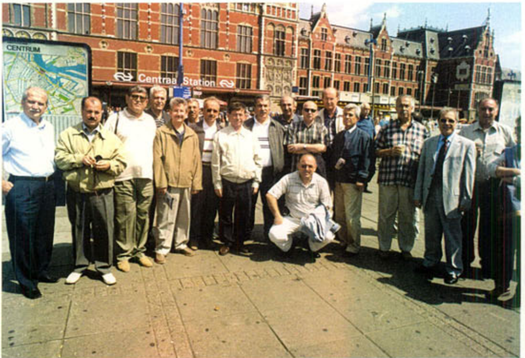
Amsterdam, otelin önünde