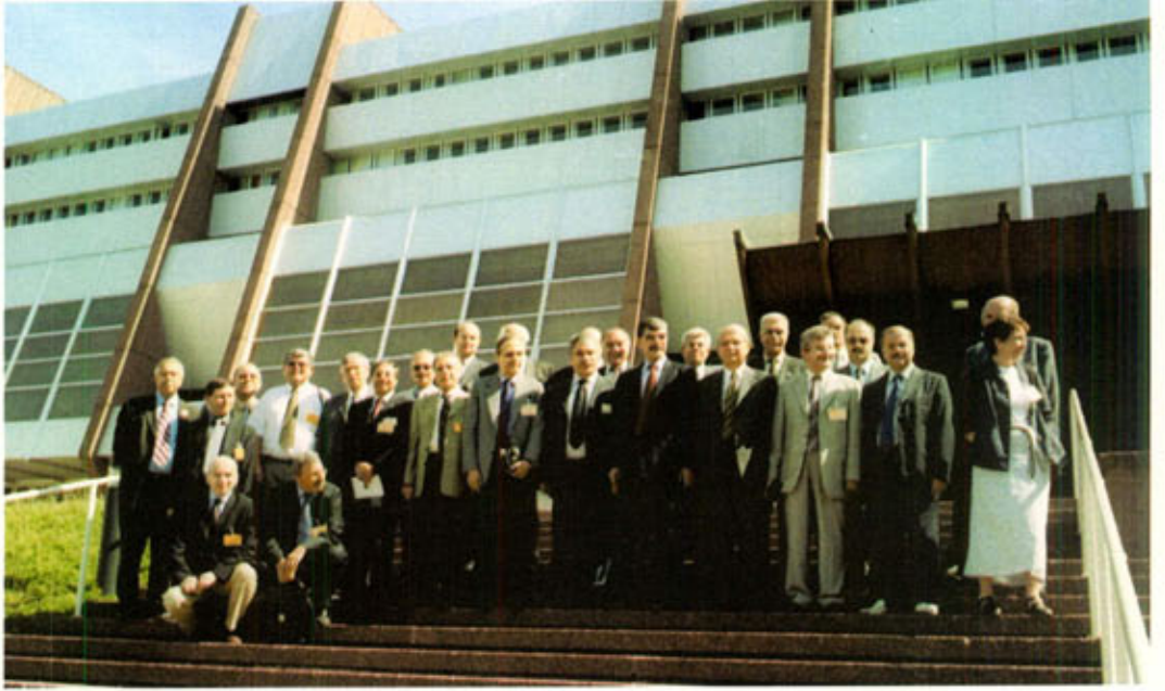
Avrupa Konseyi binası önünde