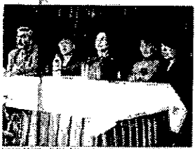
Karabük'te düzenlenen konferansa kadın konfederasyonları aile içi şiddetin birincil nedeni olarak toplumsal değişimi belirledikleri gündeme gelmişti.

K arabük'te düzenlenen konferansa kadın konfederasyonları aile içi şiddetin birincil nedeni olarak toplumsal değişimi belirledikleri gündeme gelmişti. Karabük'te düzenlenen konferansa kadın konfederasyonları aile içi şiddetin birincil nedeni olarak toplumsal değişimi belirledikleri gündeme gelmişti.