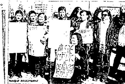
Medeni Kanun'un 75. Yılı

Medeni Kanun'un kabul edilmesinin 75. yıldönümünde Anıtkabir ziyaret eden kadınlar demokrasi, eşitlik ve barış için yürüdü