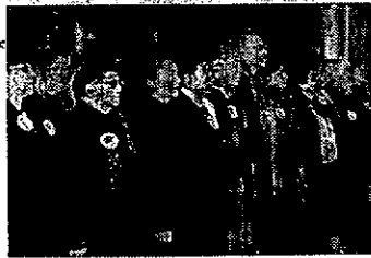
YAYGI DURUŞUNDA BULUNDULAR

52 demokratik kitle örgütüne mensup kadınlar, dün yaptıkları gösterilerle Meclis'te görüşülen Medeni Kanun'un aynen kabulü isteklerini yinelediler