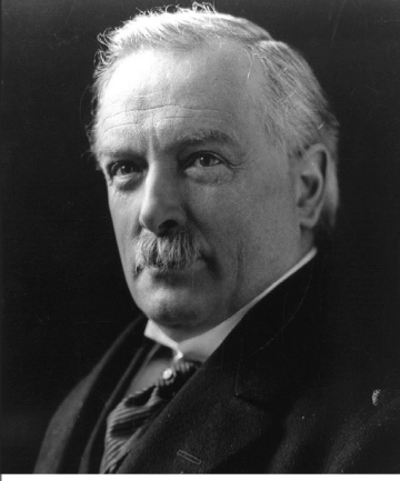
Resim-1 : İngiltere Başbakanı Lloyd George (1863 - 1945)

İngiltere'nin Engelleme Girişimleri: Özellikle İngiltere bağımsız bir Müslüman ülkenin bulunmasını, Müslüman sömürgeleri bulunan ülkeler için rahatsızlık verici olarak görmüştür. Bağımsız Müslüman bir ülkenin örnek alınabilir olması, sömürgeci düzeni tehdit edebilirdi. İşte Anadolu'da kapitülasyonlara karşı olan, milli bir ekonomi kurma amacıyla bulunan tam bağımsız bir hareketin gelişmekte olması, sömürge olan bütün