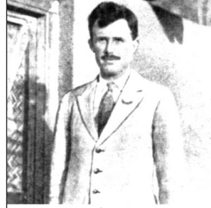
Resim-2 : İngiliz Binbaşı E:W:C. Noel

Noel, Kürtler üzerinde etkili olabilmek için, öldürülen Ermenilerle ilgili olarak af ilan edilmesini ve sadece Ermenilere ait taşınmaz malların geri istenmesi konusunda bir duyuru yapılmasını İngiltere'den istemiştir. Çünkü öldürülen Ermeniler ile ilgili olarak çoğunlukla Kürtler sorumlu görülmektedir. Bu da Kürtçülerin, İngiltere'ye yaklaşmasını engellemiştir. Bunun üzerine Balfour da, Kürtlere karşı intikamcı bir siyaset izlenmeyeceği konusunda Noel'in garanti verebileceğini bildirmiştir.